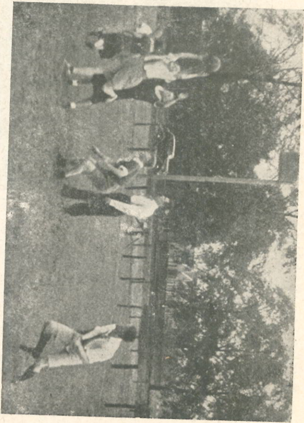
De verenigingscontributie verschilt eveneens vrijwel niets van voetbal en bedraagt pl.m. f. 1.— tot f. 1.25 per maand.

De kosten voor het beoefenen van deze sport zijn vrijwel gelijk aan die van voetbal (in het eerste artikel besproken). Shirt, broekje of rok, en kousen zijn ook hier noodzakelijk, terwijl het schoeisel veelal uit gymnastiekschoenen bestaat. Er zijn echter ook speciale korfbalschoenen.